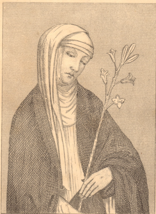
VERO RITRATTO DI SANTA CATERINA DA SIENA